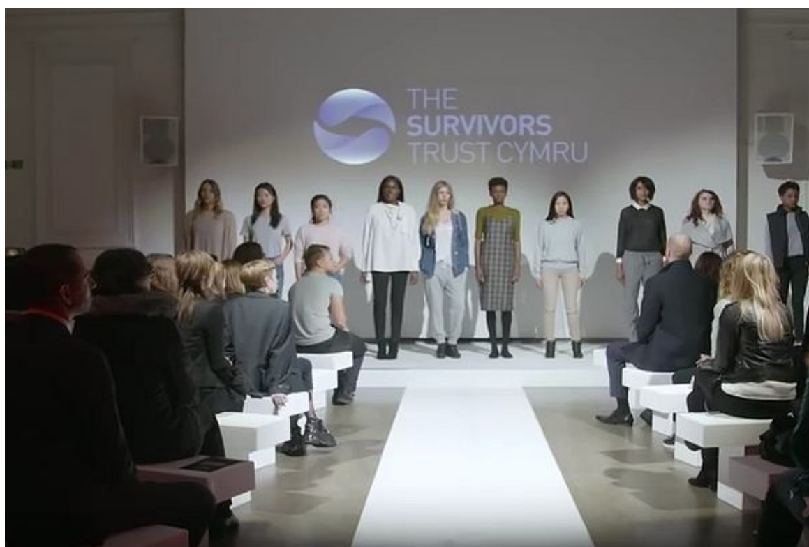
Fot. 1. Kadr z pokazu, przedstawiający stroje kobiet zgwałconych

Należy też zaznaczyć, że żaden strój, nawet uznany za uwodzicielski , nie nakłada na ofiarę odpowiedzialności za jej skrzywdzenie a bycie miłym względem płci przeciwnej nie jest przyzwoleniem na bliskość cielesną. Niepokoii jednak fakt, iż na pytanie: Po czyjej stronie, wedle Pani/Pana opinii, leży wina w przypadku popełnienia przestępstwa gwałtu? jedynie 50% kategoriycznie wskazuje sprawcę, 45% ankietowanych wybrało odpowiedź głównie sprawcy , co wskazuje na częściową winę ofiary, 5% wskazało równy podział odpowiedzialności za to zdarzenie.