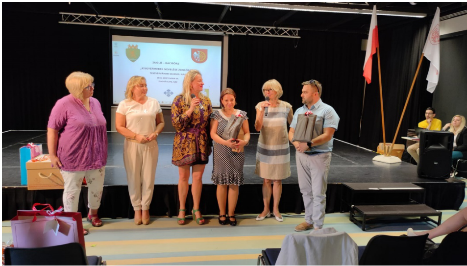
Zdjęcie 1. Wizyta studyjna nauczycieli raciborskich w Budapeszcie 29.09-01.10.2023 r.