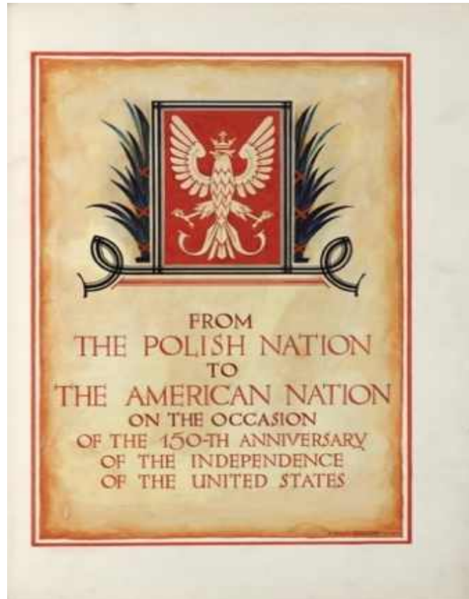
Fot. 3. Polska Deklaracja o Podziwie i Przyjaźni dla USA z 1926 roku

skania niepodległości przez USA, Polacy przygotowali „Polską Deklarację o Podziwie i Przyjaźni dla Stanów Zjednoczonych”. Kolekcja 111 tomów podpisów, życzeń, ilustracji i zdjęć została podpisana przez Prezydenta RP oraz 5,5 miliona obywateli ówczesnej Polski. Deklaracja została przekazana prezydentowi Calvinowi Coolidge’owi 14 października 1926 roku w Białym Domu.