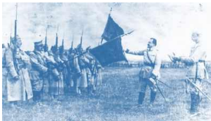
Fot. 2. Błękitna Armia generała Hallera

Stosunki strategiczne między Polską a Stanami Zjednoczonymi są jednymi z najważniejszych aspektów polityki obronnej Polski. Współpraca ta ma swoje korzenie w dziesięcioleciach, kiedy Polska jako kraj bloku wschodniego była sojusznikiem Związku Radzieckiego i była zmuszona do wprowadzenia radzieckiej doktryny obronnej. Stosunki dyplomatyczne między Polską a Stanami Zjednoczonymi Ameryki zostały nawiązane 2 maja 1919 r. USA odegrały ważną rolę w procesie odzyskania przez Polskę niepodległości po I wojnie światowej, a w 1919 były pierwszym supermocarstwem, które uznało odrodzone państwo polskie. Podczas I wojny światowej znane polskie osobistości – Ignacy Jan Paderewski i Henryk Sienkiewicz podróżowali do Stanów Zjednoczonych, aby promować ideę niepodległej Polski. Wielu Amerykanów polskiego pochodzenia przyjechało do Europy, aby walczyć o suwerenną Polskę, czego najbardziej znanym przykładem jest Błękitna Armia Hallera. Utworzona pod dowództwem Generała Józefa Hallera, zrzeszała ponad 20.000 Amerykanów polskiego pochodzenia.