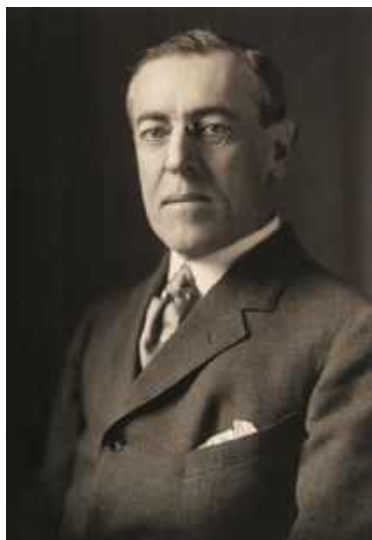
Fot. 1. Prezydent Woodrow Wilson (1914)

Stworzenie niepodległego państwa polskiego na terytoriach zamieszkałych przez ludność bezsprzecznie polską, z wolnym dostępem do morza, niepodległością polityczną, gospodarczą, integralność terytoriów tego państwa powinna być zagwarantowana przez konwencję międzynarodową.