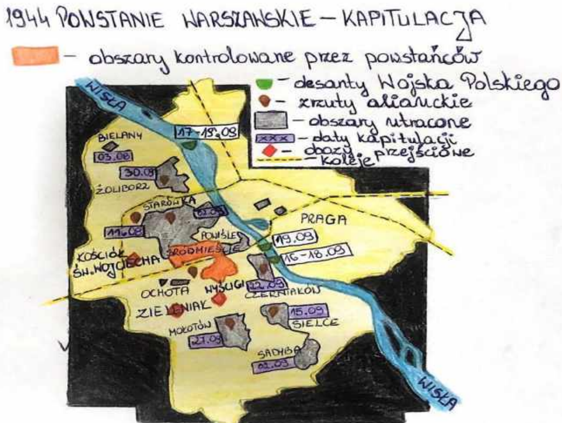
Mapa 3. 1944 rok – powstanie warszawskie – kapitulacja