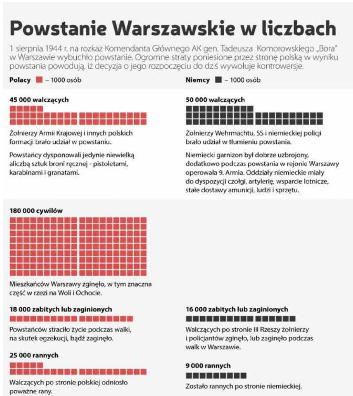
Fot. 1. Powstanie warszawskie w liczbach