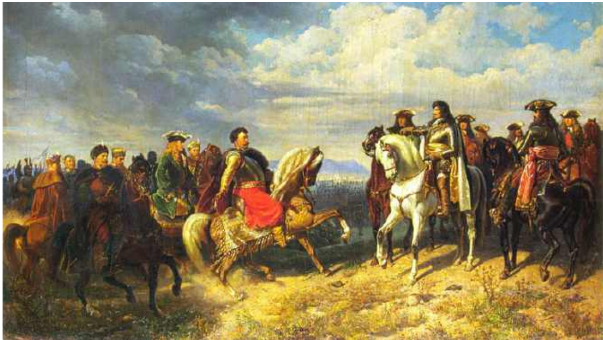
Źródło: Artur Grottger, Spotkanie Jana III Sobieskiego z Leopoldem I

Słońce zaszło, gdy bitwa dobiegła końca. Wkrótce król Sobieski udał się do namiotu głównego wodza Turków. Zakazał płądrowania obozów, obawiając się kontrataków. W tym czasie siły cesarskie, maszerując przy Dunaju, walczyły z grupami pozostałych Turków i zmierzały do stolicy. Według kronikarzy tureckich Austriacy odnaleźli w okopach około 10 000 chorych i rannych wojowników osmańskich. Wszystkich zabito. Wiedeń został uratowany, armia osmańska została pokonana, ale nie rozbita. Szacuje się, że w bitwie padło 8 000 poddanych sułtana, a licząc osoby zabite podczas pościgu i wymordowanych jeńców, ogólne straty armii tureckiej dochodziły do 15 000. Następnego dnia uwolniono wielu jeńców austriackich, a żołnierze rozpoczęli rabunek. Najbogatsza część przypadła Polakom. Armaty z amunicją zostały przekazane Austriakom.