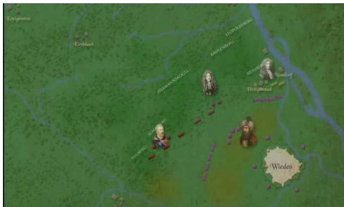
Mapa 3. Przedstawienie mapy walk