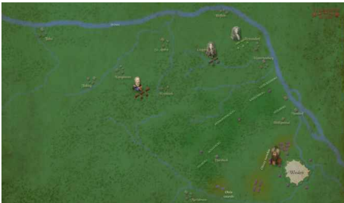
Mapa 2. Rozstawienie wojsk