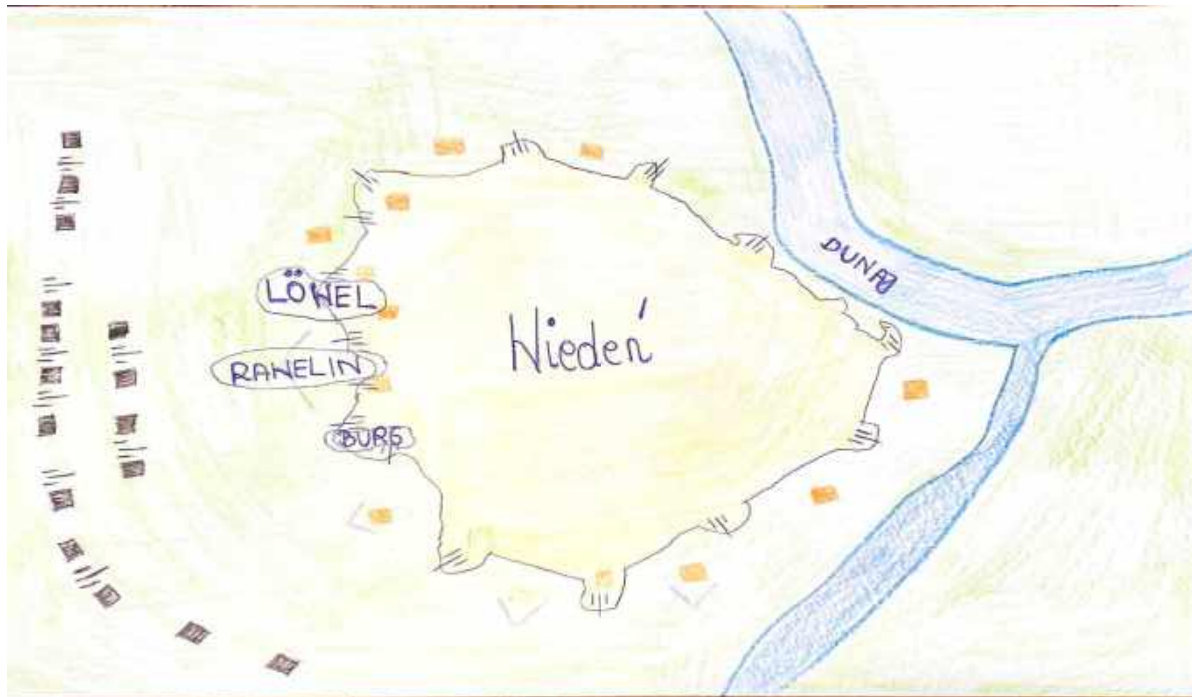
Mapa 1. Przedstawienie mapy Wiednia podczas ataku wojsk osmańskich