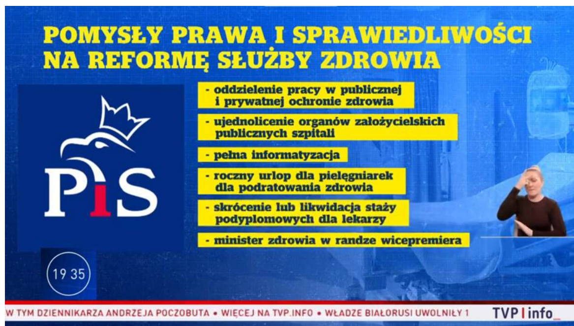
Rys 4: Pomysły Prawa i Sprawiedliwości na reformę służby zdrowia

o potrzebie zwiększenia skali szkoleń wojskowych, natomiast przedstawiciele Ministerstwa Obrony Narodowej informowali, że obecnie nie ma planów przywrócenia obowiązkowej służby wojskowej i że realizowane są szkolenia dla rezerwy.