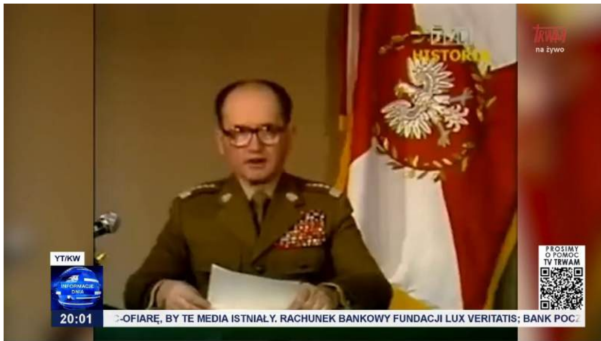
Rys 5: Wspomnienie ogłoszenia stanu wojennego

Materiał otwiera blok rocznicowy poświęcony stanowi wojennemu. Lektorka prowadzi narrację historyczną, krok po kroku przypominając, co działo się w Polsce w tamtym okresie. W tle pojawiają się wplecione fragmenty przemówienia gen. Wojciecha Jaruzelskiego, które pełnią funkcję archiwalnego kontekstu i wzmacniają „historyczny” charakter relacji.