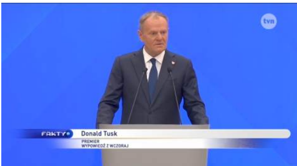
Rys 2: Donald Tusk – Wypowiedź premiera

Dwa lata rządu koalicji rządzącej: Segment poświęcono ocenie rządu Donalda Tuska w formule konfrontacyjnej: władza prezentuje profesjonalizm komunikacyjny, a opozycja neguje jakiegokolwiek osiągnięcia. W materiale Katarzyny Kolendy-Zaleskiej pokazano kompilację nagrań ministrów powtarzających slogan „Robimy to, bo kochamy Polskę”, co lektorka określa jako przygotowaną z rozmachem strategię wizerunkową.