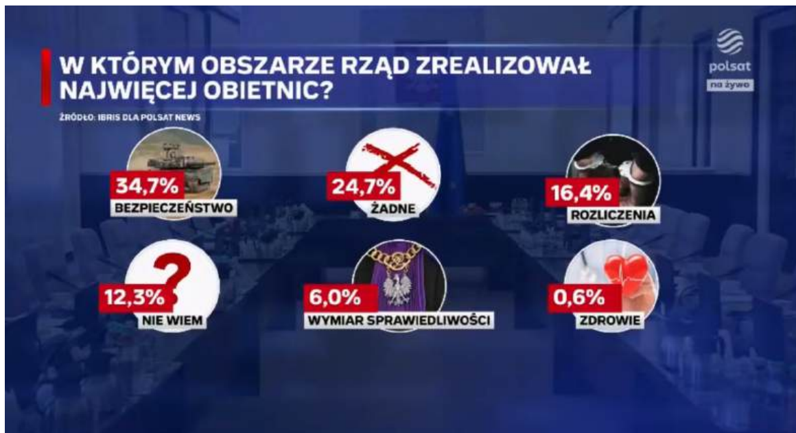
Rys 1: Podsumowanie sondażu

wym elementem jest przywołanie sondażu, w którym ponad połowa Polaków negatywnie ocenia rząd. Narracja stacji przesuwająca ciężar dyskusji z sukcesów politycznych rządu na codzienny byt obywatela, co w dniu rocznicy zaprzysiężenia ma szczególnie silny wydźwięk krytyczny.