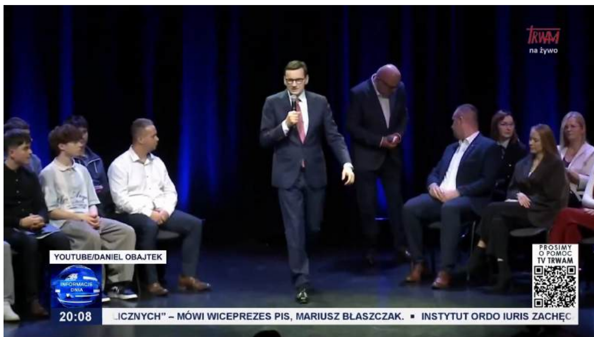
Rys 6: Były premier Mateusz Morawiecki